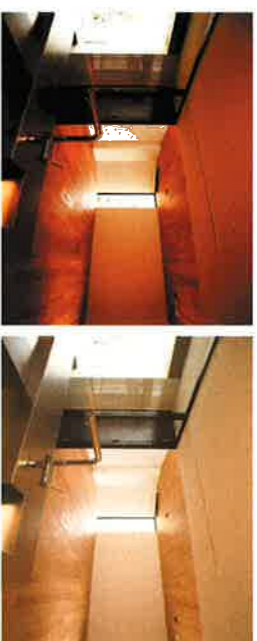
左：デジタルカメラで撮影しただけの写真 右：カメラマンによる撮影画像

大切なのは商品の品質。撮影は脇役ですが、お客様は“目”で商品を見ています。撮影の力によって、購買力に“火”がつく商品が多いのはその為です。大切なのはやはり“見せ方”。だから、商品を魅力的に見せることができるカメラマンを起用することが、最重要ポイントとなります。