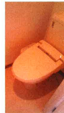
※ウォッシュレット