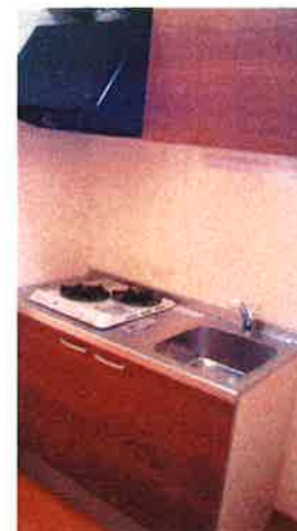
※システムキッチン