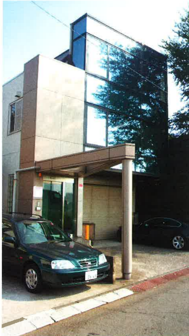
ガラス壁面がデザイン性を強調しております