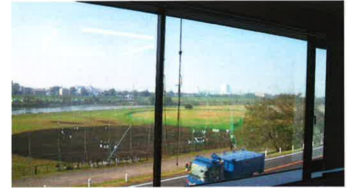
3Fから旧巨人軍グラウンドを撮影 (H21.11月)