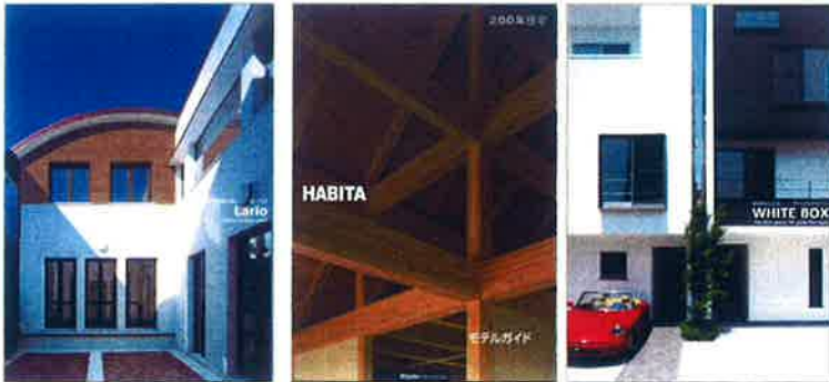
コモ湖畔の風 ～ Lario