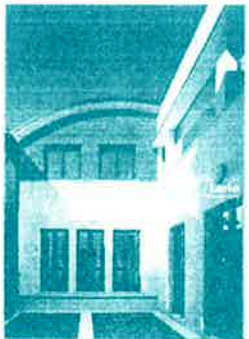
コモ湖畔の風 ～ Lario