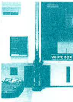
自由自在な住まい ～ WHITE BOX

建築条件は付いておりませんのでお客様が選んだハウスメーカーに建築を依頼しても全く問題ありません。しかしハウスメーカーとの接触もなく建築資金等に不安を抱いている方へは建築業者のご紹介も可能です。