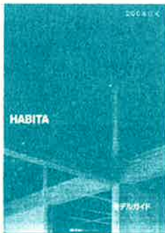
200年住宅 ～ HABITA