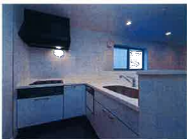
D号棟/カウンターキッチン