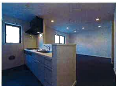
B号棟/カウンターキッチン