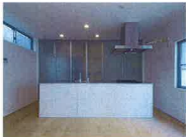
A号棟/アイランドキッチン