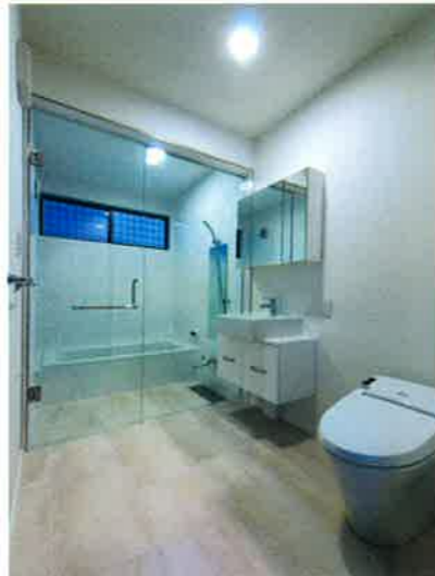
■サンタリー/バスタブ・洗面器(イタリア輸入) タンクレスシャワートイレ