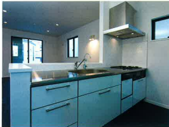
■システムキッチンYAJIMA/専用浄水器・食器洗い乾燥機

□「自然にLDKは家族が集まる居心地が良い空間」をコンセプトに天井を約H=2,600mmの高さとしました。またキッチンオープンスタイルとし解放感の演出も忘れておりません。