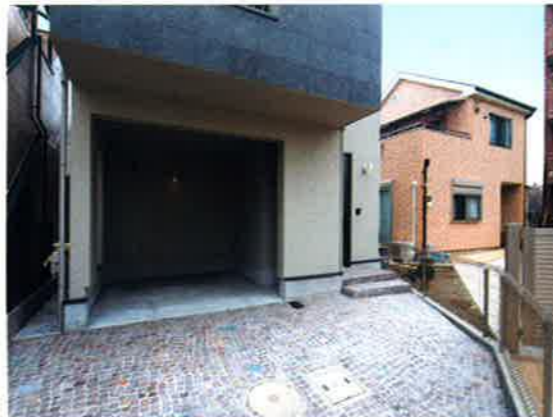
■アプローチ/イタリア天然舗石「ポリフィド」