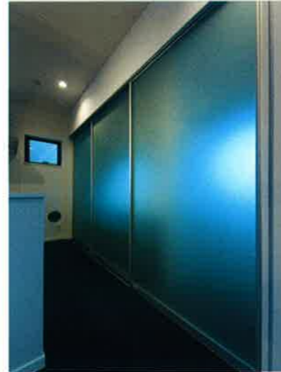
■キッチン収納/オリジナルガラス引戸 (フロスト)