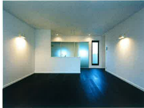
■LDK/天井高さ 約H=2,600mm フローリング (ヴェンゲ色)