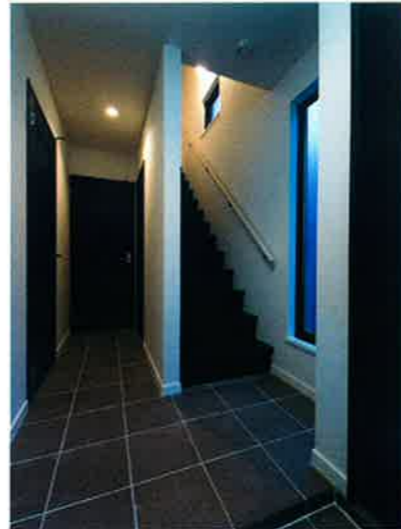
■玄関ホール/床タイル(イタリア輸入)