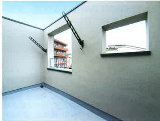
■3Fバルコニー/6.62m 2 (壁芯3640×1820)