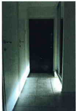
イタリア輸入タイル(床)