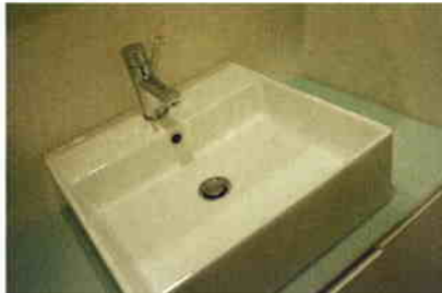
洗面化粧台/イタリア輸入