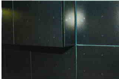
キッチンタイル/イタリア輸入