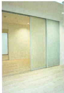
オリジナル引戸(ガラス製)