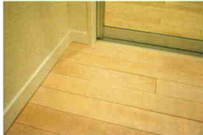
無垢フローリング