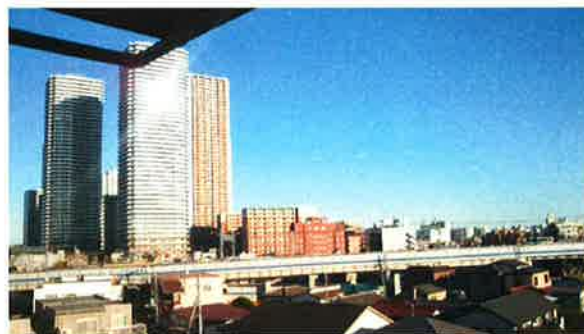
☆バルコニーからの眺望【撮影5階部分】