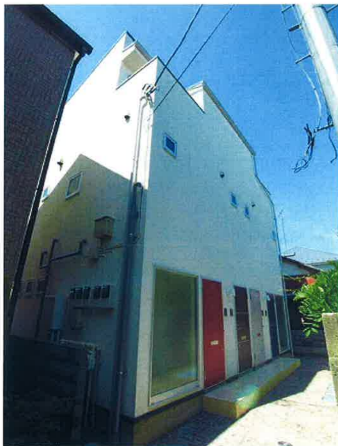
駐輪場スペースあり (イタリア天然舗石敷)

賃料 118,000 円 管理費 2,000 円 礼金 1ヶ月分 敷金 1ヶ月分