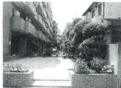
敷地内公園/平成21年7月撮影