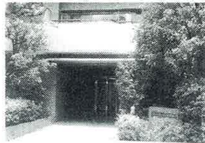
エントランス/平成21年7月撮影