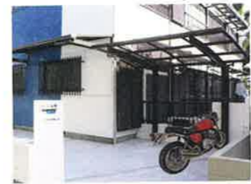
バイク・自転車置場 (3/末契約まで無料)