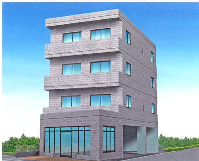
※パースは完成イメージ図となります