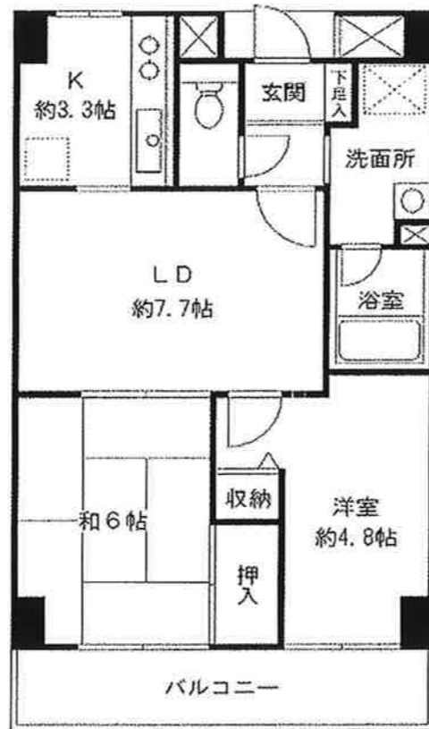
※イラストはイメージです。★人気の振り分けタイプ★