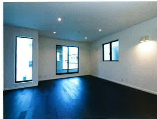
■LDK/約20.5帖 フローリング(ヴェンゲ色)