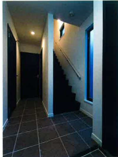
■玄関ホール/床タイル(イタリア輸入)