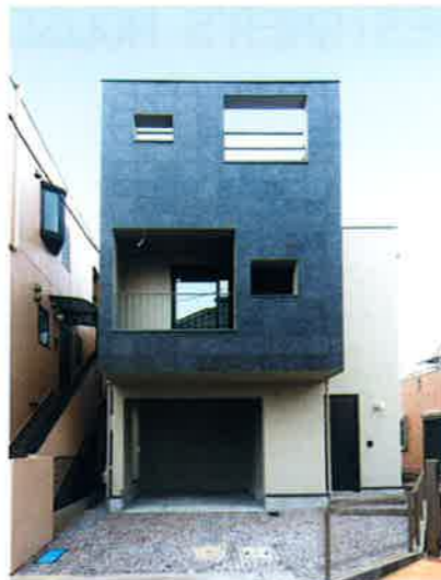
■外壁/前面一部タイル(イタリア輸入)