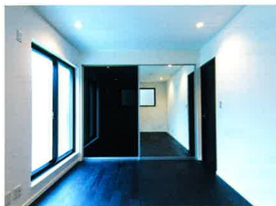
■主寝室(約7.5帖)/オリジナルミラー引戸(鏡等)