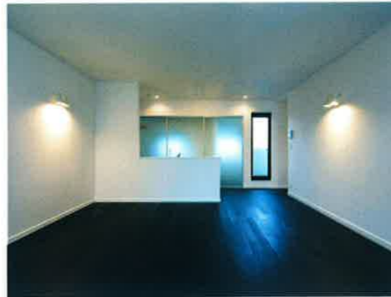
■LDK/天井高さ 約H=2,600mm フローリング (ヴェンゲ色)