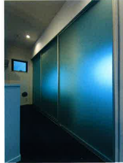
■キッチン収納/オリジナルガラス引戸 (フロスト)