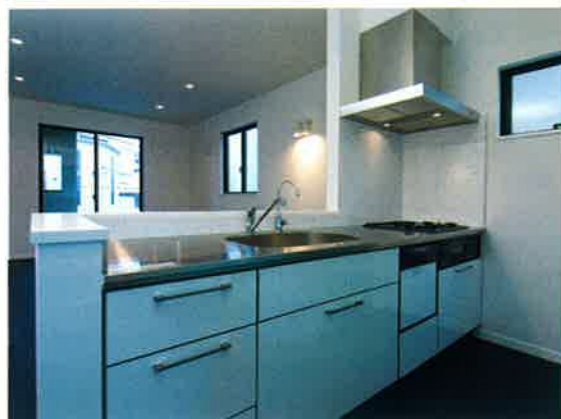
■システムキッチンYAJIMA/専用浄水器・食器洗い乾燥機

□「自然にLDKは家族が集まる居心地が良い空間」をコンセプトに天井を約H=2,600mmの高さとしました。またキッチンオープンスタイルとし解放感の演出も忘れておりません。