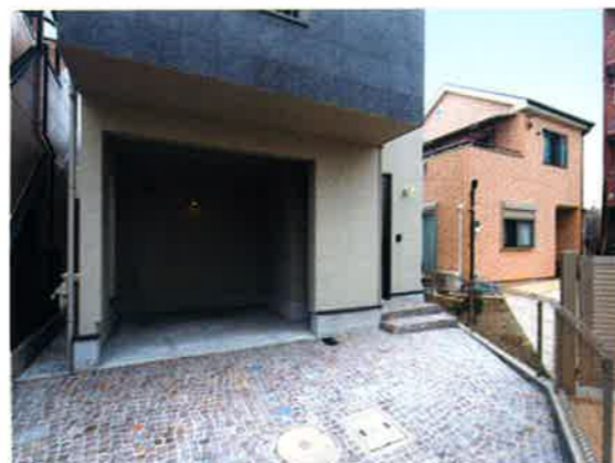
■アプローチ/イタリア天然舗石「ポリフィド」