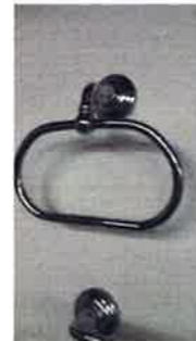
タオル掛け等/イタリア輸入 Valli&Valli