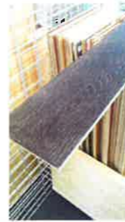
フローリング/Kasco 社 ヴェンゲ