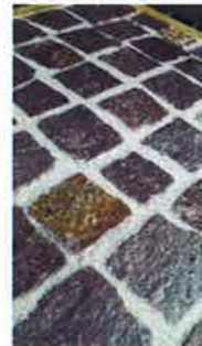
アプローチ/イタリア天然舗石