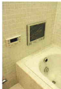
浴室テレビ 12.1インチ