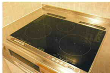
I Hクッキングヒーター