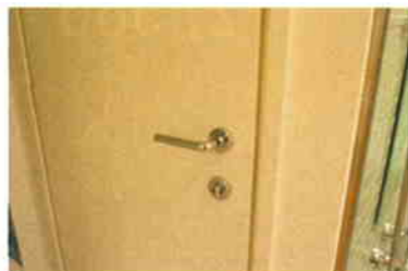
イタリア輸入家具/ACEM社