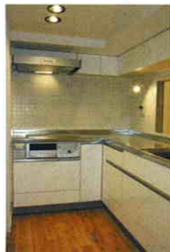
システムキッチン/クリナップ(混合水洗&浄水器付)